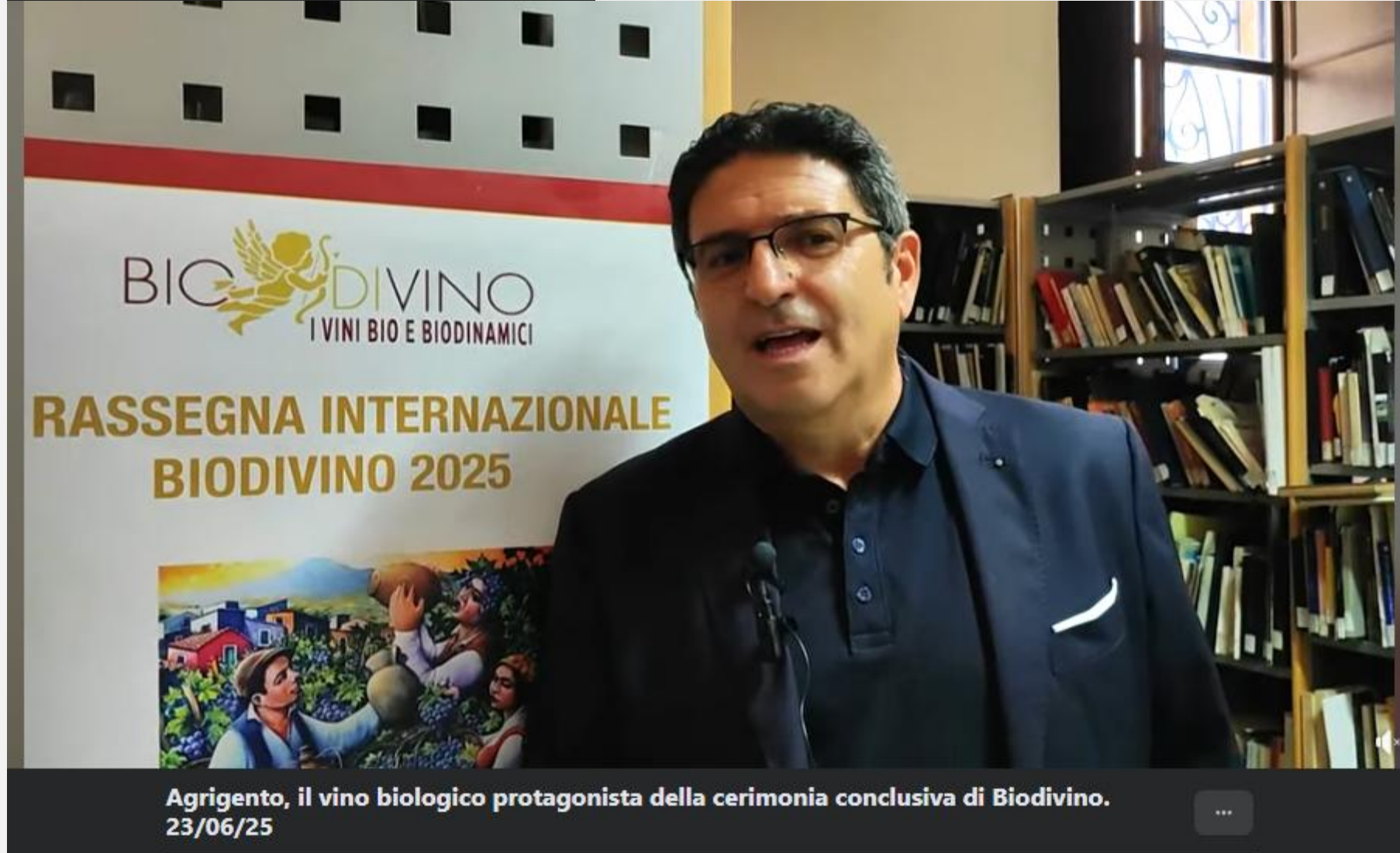
Agrigento, il vino biologico protagonista della cerimonia conclusiva di Biodivino. 23/06/25

https://www.facebook.com/watch/?v=599312986124848