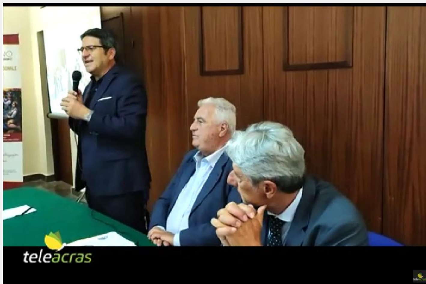
Ad Agrigento, nell'ambito delle iniziative "Capitale Cultura", nella biblioteca comunale "La Rocca" la cerimonia conclusiva della rassegna internazionale "Biodivino", organizzata da Italia Bio, sulle eccellenze vinicole...